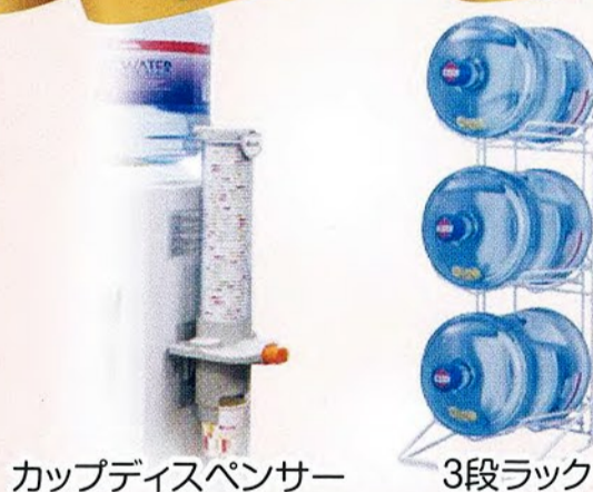
カップディスペンサー